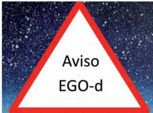
Figura 1. Aviso o peligro de ego-d.